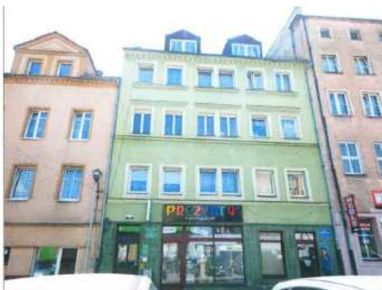
Widok elewacji frontowej – ul. Tkacka nr 8.

na sprzedaż lokalu mieszkalnego Nr 8, znajdującego się w budynku położonym w Lubaniu przy ul. Tkackiej 8 wraz z udziałem we współwłasności nieruchomości gruntowej (działka nr 24, AM 6, Obręb III o powierzchni 237 m 2 , JG1L/00016410/2)