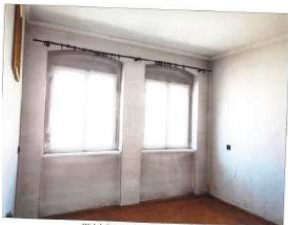
Widok fragmentu większego pokoju.