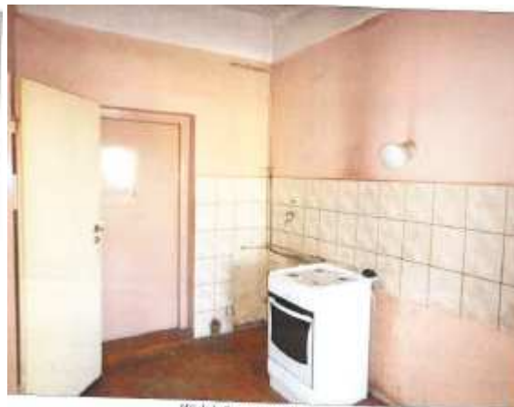
Widok fragmentu kuchni.