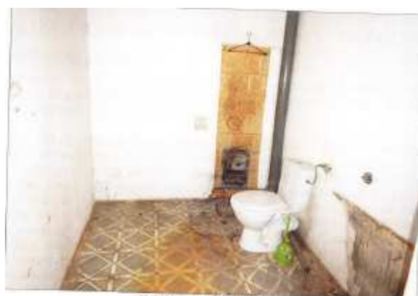
Widok fragmentu łazienki z wc.