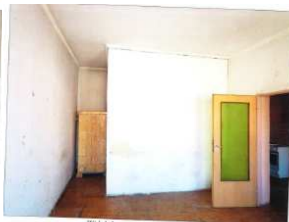
Widok fragmentu większego pokoju.