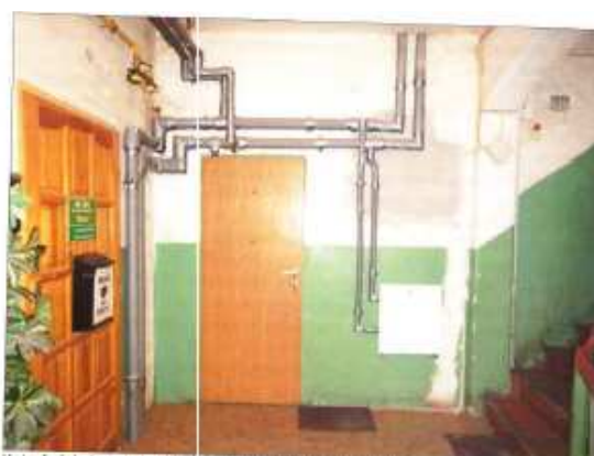
Wejście do lokalu – widoczna sieć centralnego ogrzewania z przygotowaną stacją dla lokalu.