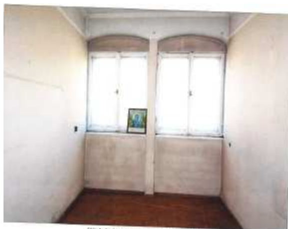
Widok fragmentu mniejszego pokoju.